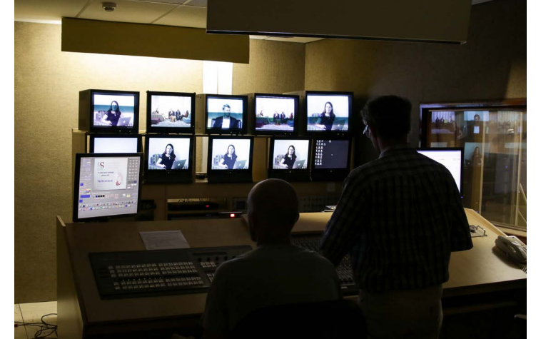
Agter die skerms...

voedingswetenskapopleiding en -navorsing by universiteite in Oos- en Suider-Afrika op te skerp; die bydrae deur voedsel- en voedingswetenskapdepartemente aan universiteite te verhoog om die kontemporêre menslikehulpbronne en navorsingsbehoefte van die voedsel-, voeding- en landbousektore te kan aanspreek; en die samewerking tussen deelnemende instansies te bevorder om die uitruil van inligting en die deel van opleiding- en navorsingshulpbronne