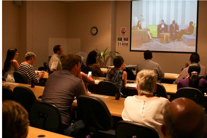
Mense kyk na die regstreekse uitsending in die Sentrum vir Leertegnologieë op die Stellenbosch-kampus.

voedingswetenskapopleiding en -navorsing by universiteite in Oos- en Suider-Afrika op te skerp; die bydrae deur voedsel- en voedingswetenskapdepartemente aan universiteite te verhoog om die kontemporêre menslikehulpbronne en navorsingsbehoefte van die voedsel-, voeding- en landbousektore te kan aanspreek; en die samewerking tussen deelnemende instansies te bevorder om die uitruil van inligting en die deel van opleiding- en navorsingshulpbronne