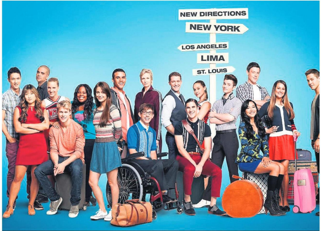
Die groep akteurs wat te sien is in die reeks Glee , waarin uiteenlopende en komplekse karakters uitgebeeld word.

Ek dink toe weer aan 'n wonderlike toneel in een van die ver-hale wat ek gebruik het in my boek Writing and Reading to Survive , wat poeg om Bybelse en kontemporêre trauma-narratie-