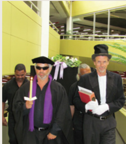
Die "predikant" en "begrafnisondermemer" lei die "begrafnis" van die JS Gericke Biblioteek se kaartkatalogus.

Tydens die seremonie – waarin die leë kaartkataloguskas deur draers na die personeelkamer gedra is, met 'n "predikant",