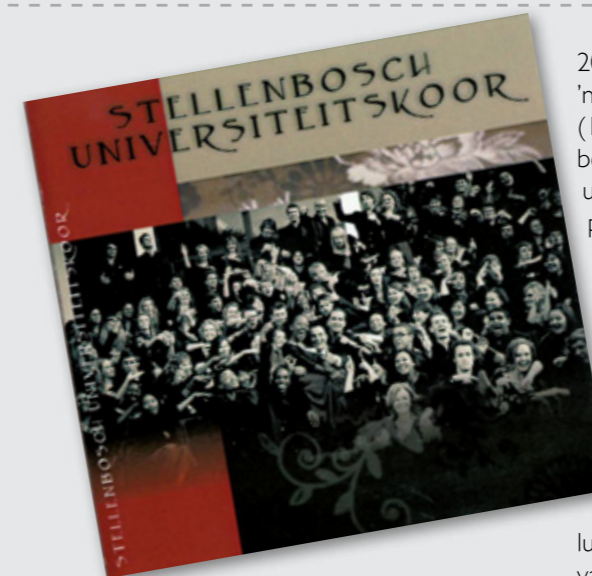
Die koor se nuwe CD bevat meestal gewyde musiek deur

Die US-koor is die oudste universiteitskoor in die land en het verlede jaar sy 75ste bestaansjaar gevier met 'n reünie wat oor 'n naweek in September gehou is. 'n Konsert waarin ook oudlede saamgesing het, is in die Endlersaal gehou.