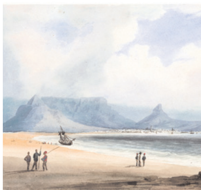
Table Mountain from the beach of Table Bay by Charles Davidson Bell (watercolour, 14 x 22 cm, Bell Heritage Trust Collection, UCT)

During this short period he produced approximately 90 watercolours and pencil sketches of Cape Town and its environs as well as of his journey through Stellenbosch and Franschoek