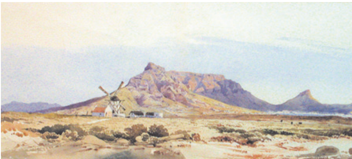
Table Mountain from Salt River by Solomon Caesar Malan (watercolour, 44 x 76,5 cm, Stellenbosch University Museum Collection)