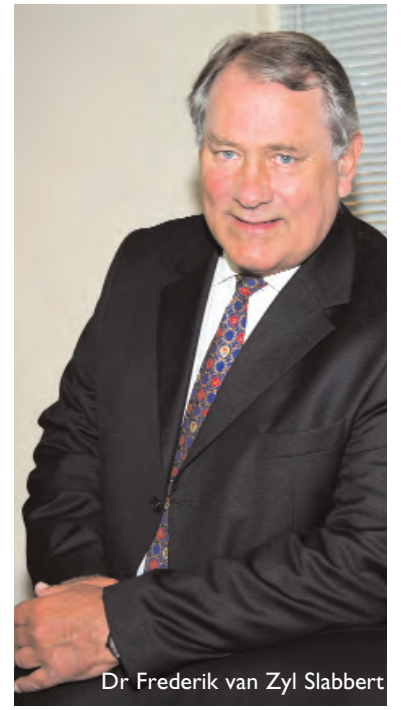
Dr Frederik van Zyl Slabbert

Die Goree Institute in Senegal, The Open Society Initiative for Southern Africa, en The Institute for a Democratic Alternative in Zimbabwe (IDAZIM) is almal maar voortvloeiels van die oorspronklike Idasa/Dakar-gebeure. Met ander woorde, dit is almal pogings om gesprek en