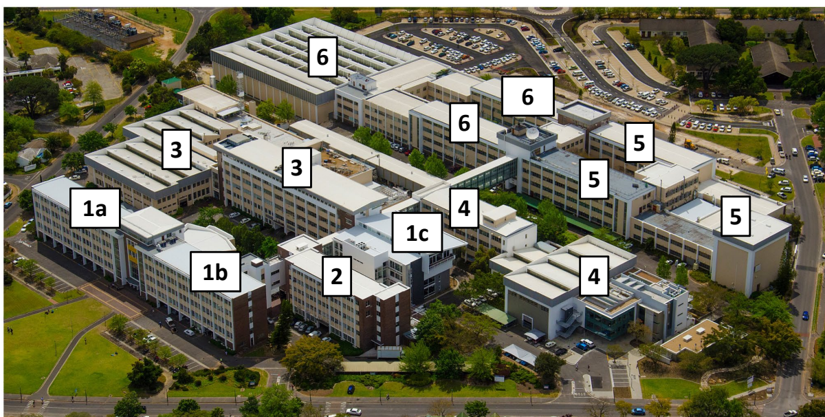
Figuur 1.1: Die Ingenieurswese-gebouekompleks (die nommers word in die beskrywings hieronder gebruik).

Die huidige gebouekompleks aan Banhoekweg, Stellenbosch, is in die sewentigerjare stelselmatig voltooi en sedertdien van tyd tot tyd verder uitgebrei, soos met die byvoeging van die Kennisentrum in 2012. Die onderstaande figuur is 'n lugfoto van die gebouekompleks.