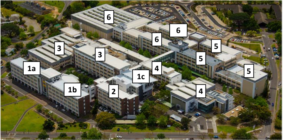
Figuur 1.1: Die Ingenieurswese-gebouekompleks (die nommers word in die beskrywings hieronder gebruik).

Die huidige gebouekompleks aan Banghoekweg, Stellenbosch, is in die sewentigerjare stelselmatig voltooi en sedertdien van tyd tot tyd verder uitgebrei, soos met die byvoeging van die Kennisentrum in 2012. Die onderstaande figuur is 'n lugfoto van die huidige kompleks.