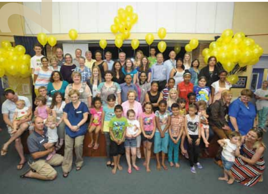
US se Kogleëre Inplantingseenheid by Tygerberghospitaal – foto geneem met die viering van die 500ste inplanting.