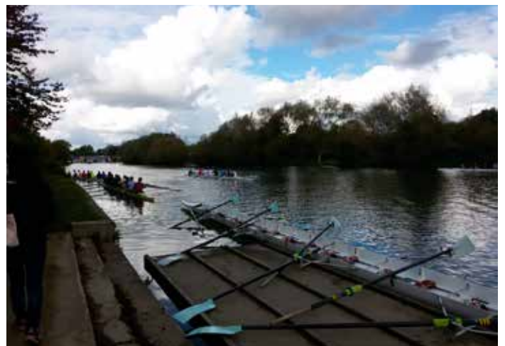
Vroegoggend roeissessie op die Teems - die mooiste tyd van die dag!

Om hier te studeer... is 'n droom - 'n fantastiese ervaring, maar ook nie ten volle werklikheid nie.