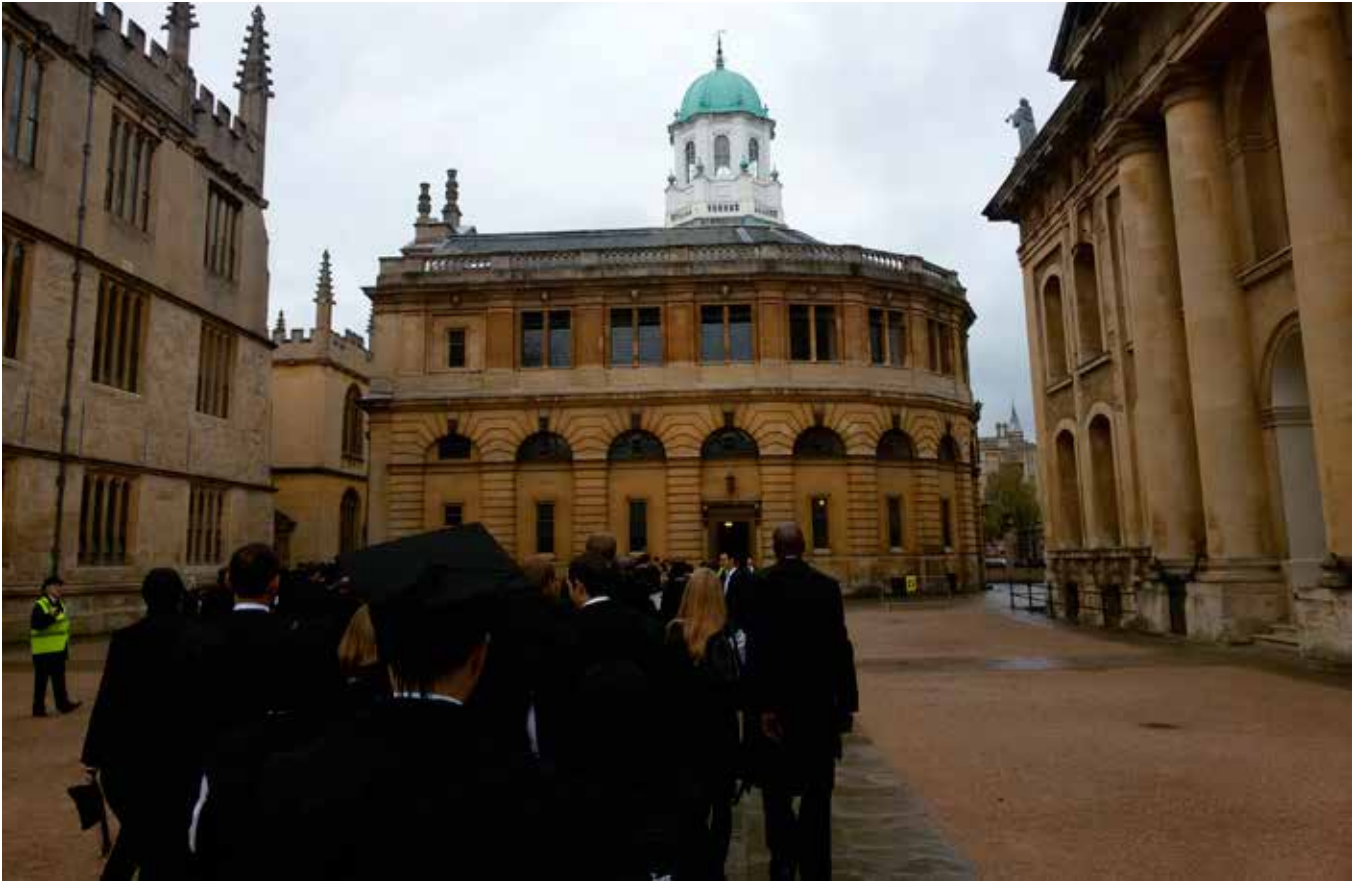
Vir Matrikulasie trek almal op na die Sheldonian-gebou. Tydens die seremonie lees die visekanselier 'n paar mooi sinne in latyn, gee 'n kort toespraak en dan is ons amptelik lede van die universiteit. Heerlik middeleeus en absurd, maar tog besonders.

die proffies bóéke, nie artikels voor nie en die meeste van hulle het al iewers vir 'n regering of president raad gegee – nie die tipe mense vir wie jy gaan uitstel vra omdat jy “koshuisverpligtinge” gehad het nie.