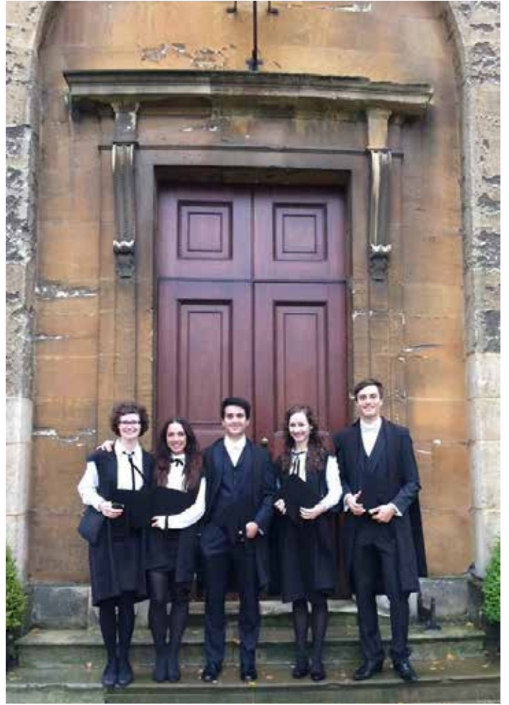
Ons maak gereed vir Matrikulasie. Die klere wat ons aan het word "subfusc" genoem (hier by Oxford hou hulle daarvan om vreemde name vir alles te gee). Matrikulasie is 'n kort seremonie waartydens nuwe studente amptelike lede van die universiteit word.

it maak nie saak hoe lank 'n mens jouself tussen die torings van Oxford bevind nie, dit bly voel asof jy op die stel van Pride and Prejudice of Downton Abbey verdwaal het: die geboue wat meer soos 'n versameling kastele as 'n universiteit lyk, die lemmetjie-groen grasperke, die ou bome wat hul herfsklere begin aantrek, die mis wat vroegoggend geheimsinnig oor die riviere hang, die huisbote en kliphuisies langs die Teems... William Yeats het oor Oxford gesê: "I wonder anybody does anything at Oxford but dream and remember, the place is so beautiful. One almost expects the people to sing instead of speaking. It is all like an opera."