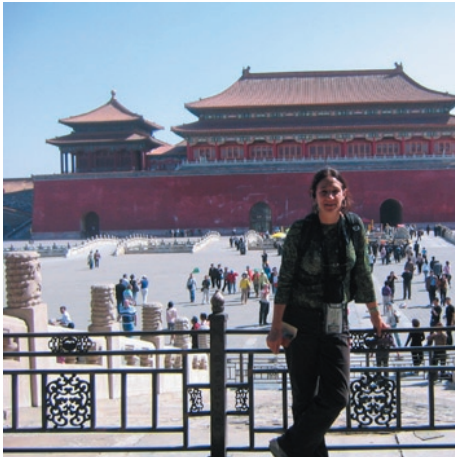
The Forbidden Palace - Beijing.