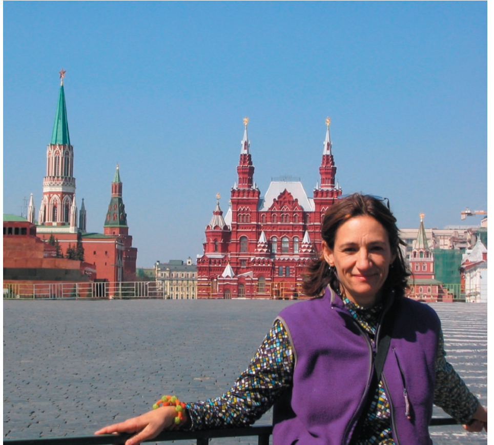
Red Square with Lenin's mausoleum and Kremlin on the left in Moscow