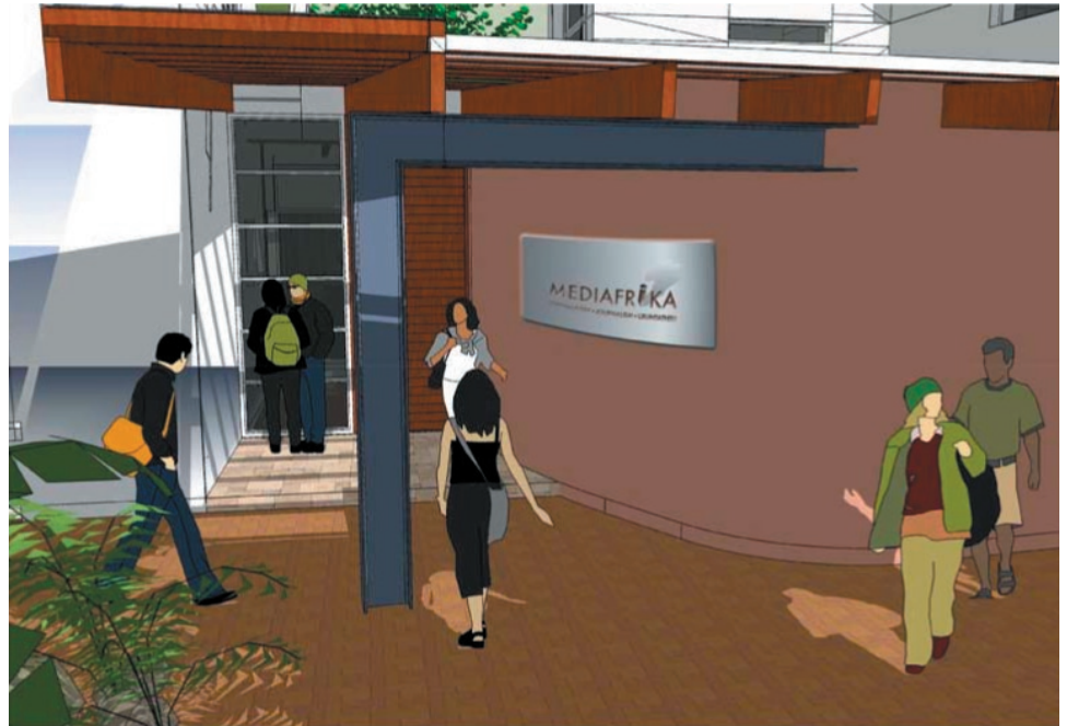
The architect's drawing of the new building.

The test is really to determine your research interests, etc (it is not similar to the BPhil thriller). A requirement for selection, among others, is to obtain 60 % for the entrance examination. You will be informed in October of the results – and of course, we look forward to have as many as possible alumni in our 2010 MPhil intake. Now is the time to give it a go!