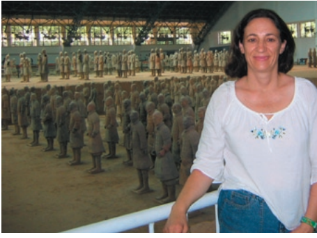
The Terracotta Army in Xi'an 1000 km from Beijing