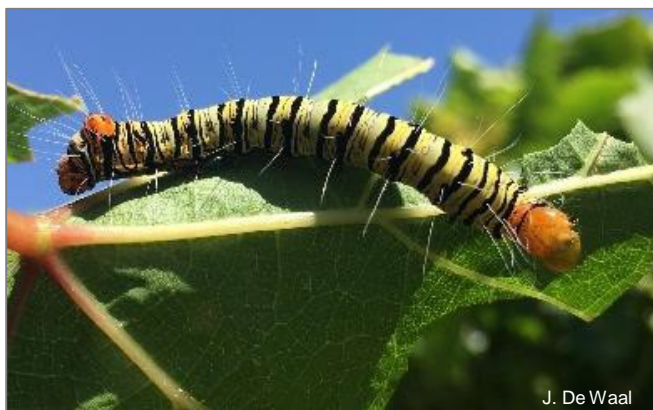
Trimen se valstiermot, Agoma trimenii , ruspe.

Tot op hede (Okt 2017), is geen insekdoders geregistreer teen Trimen se valstiermot nie, geen natuurlike vyande is geïdentifiseer nie en geen geïntegreerde beheermaatreëls is ontwikkel nie. Baie navorsing moet nog gedoen word op die biologie en beheer van hierdie pes.