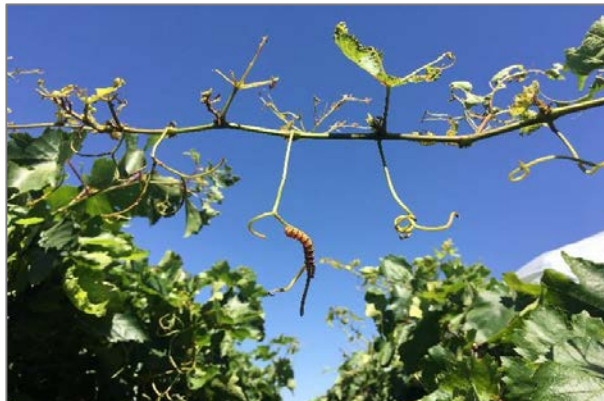
Trimen se valstiermot skade.