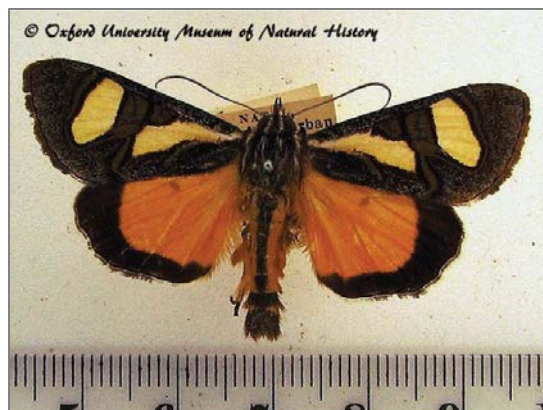
Trimen se valstiermot, Agoma trimenii , volwassene. Van: .

http://www.africanmoths.com/pages/NOC_TUIIDAE/AGARISTINAE/agoma%20trimenii.htm